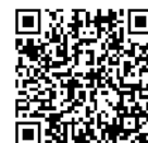
出展者向けチラシ

☎080-1598-9214 ✉supoyon@tsv2020yokkaichi.or.jp