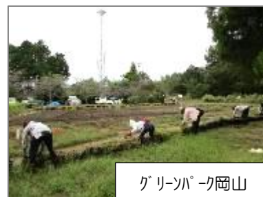
グリーンパーク岡山 (上海老町)