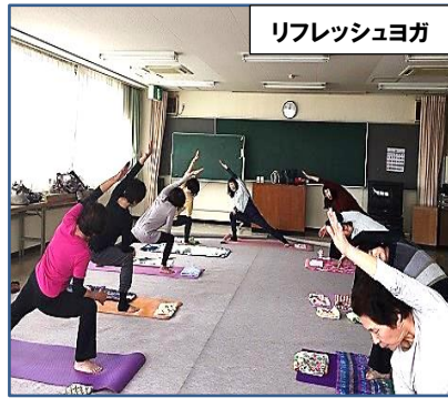
リフレッシュヨガ

日頃の運動不足や体調を意識することができ、健康を保つことができていると思います。「何をするにも健康が一番」そんなことをおしゃべりしながら、楽しくヨガをしています。